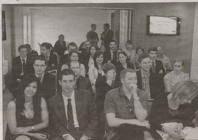
Des étudiants de la promotion 2010 du master comptabilité-contrôle-audit ont reçu leur diplôme.

Ils étaient 20 à avoir pu se libérer et rejoindre Dijon pour recevoir leur diplôme des mains de Rémy Seguin, président du conseil régional de l'Ordre des experts-comptables, Brigitte Lambey, vice-présidente de la Compagnie régionale des commissaires aux comptes